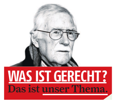
WAS IST GERECHT? Das ist unser Thema.

Umverteilungen von der wachsenden Verlierer-Mehrheit zu einer zahlenmäßig immer kleiner werdenden Gewinner-Minderheit zwangsläufig ständig zu.