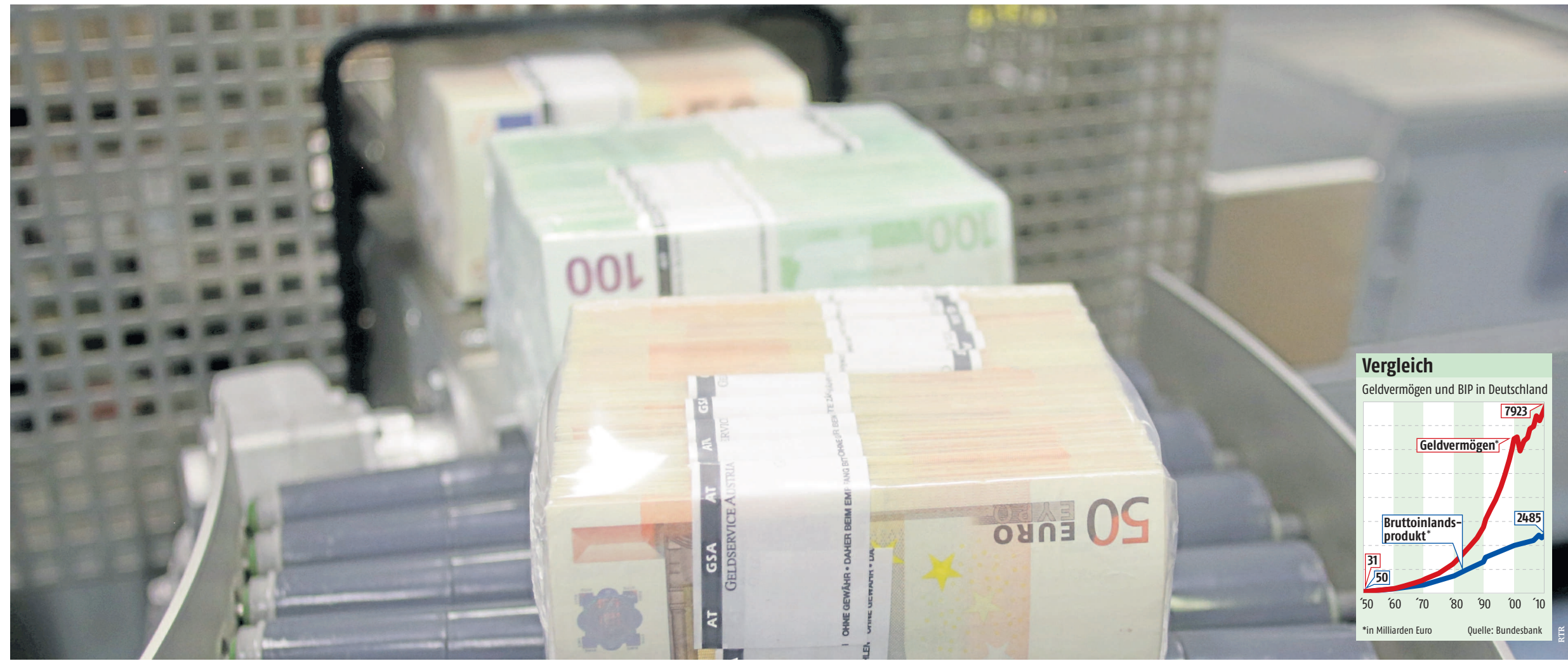
Geld ist nicht nur ein Tauschmittel: Wer viel Geld hat, kann es verleihen und daraus mehr Geld machen. Er lässt andere für sich arbeiten.

Denn alle von uns bezahlten Preise in der Wirtschaft setzen sich nicht nur aus den jeweils aufgewendeten Personal- und Materialkosten zusammen, sondern ebenso aus den produktionsbedingten Kapitalkosten, den Zinsen, gleichgültig, ob aufgenommenes oder eigenes Geld zum Einsatz kommt.